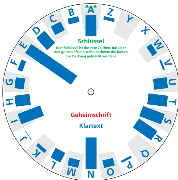
Abbildung 12.K2 Stegano-Schablone und Code- breaker für die Cäsarscheibe